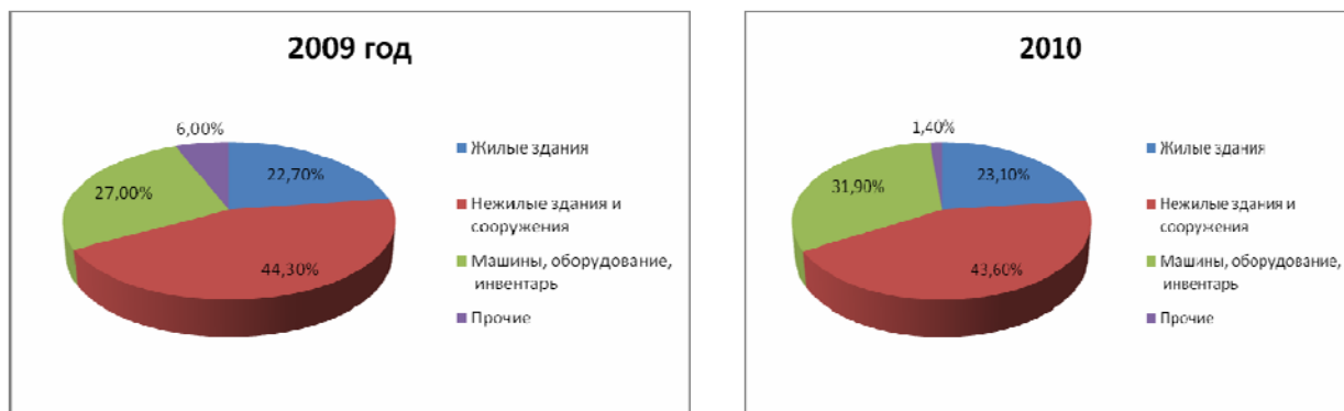
График 2: Структура инвестиций в основной капитал по видам вложений 10 (в процентах к общему объему инвестиций в основной капитал)

Инвестиции в основной капитал в 2010г., в основном, направлялись в горнодобывающую промышленность, транспорт и связь, производство и распределение электроэнергии, газа, воды и жилищное строительство, доля которых в общем объеме инвестиций в основной капитал составила около 77 процентов.